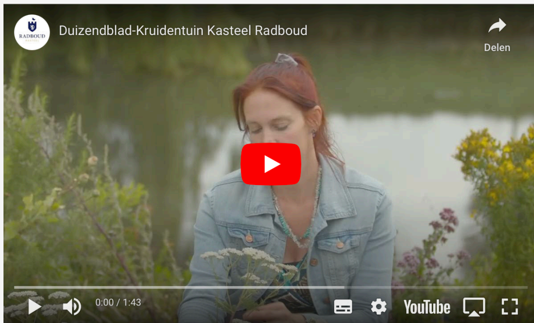
Figuur 6 Schermafbeelding van een van de video's op de kruidentuin-pagina op de website..

Aanvullend wordt de kennis over de kruidentuin op verschillende manieren toegankelijk gemaakt voor onze bezoekers. Er zijn vijf informatieve video's opgenomen met onze kruidentuin-vrijwilliger. In elk daarvan staat een kruid centraal. De video's worden in rotatie vertoond in de Casteleins Camer in het museum en zijn te zien op de kruidentuin-pagina op de website: https://kasteelradboud.nl/plan-je-bezoek/museum/kruidentuin/ .