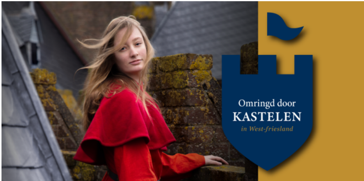
Figuur 6 Campagnebeeld ‘Omringd door Kastelen’

‘Stap in de panorama’s van de vijf kastelen die Graaf Willem II en zijn zoon Graaf Floris V in West-Friesland lieten bouwen. Kom alles te weten over de functies van deze indrukwekkende bouwwerken tijdens hun hoogtijdagen van de 13e t/m begin 15e eeuw. De panorama’s worden begeleid door verhalen van verschillende personages die bij de kastelen betrokken waren. Met de archeologische vondsten die erbij staan, is de geschiedenis van de kastelen in West-Friesland tastbaar.’