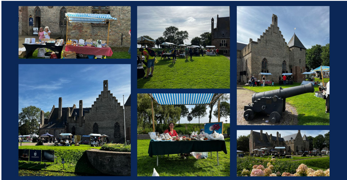
Figuur 10 Impressie Ambachtelijke Kasteelmarkt 2023.

Helaas zijn de vier geplande Waterspelletjesdagen letterlijk in het water gevallen.