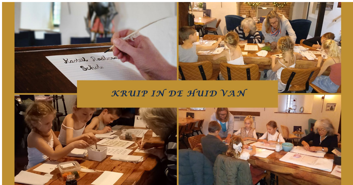
Figuur 11 Impressie van het nieuwe educatieprogramma Kruip in de huid van..

Ook in de komende jaren blijft het educatieprogramma in ontwikkeling, om te kunnen blijven aansluiten bij de leerdoelen in het onderwijs.