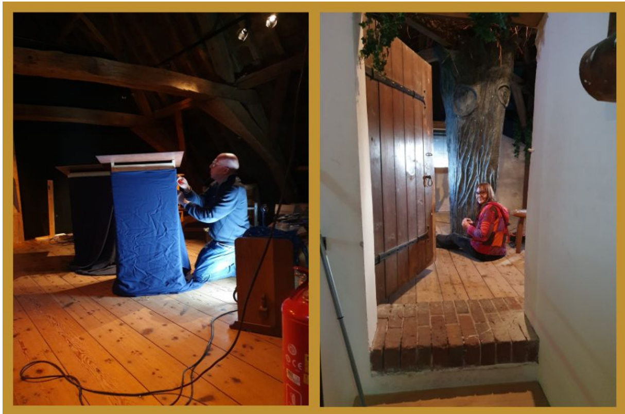
Figuur 3 Opbouw van de tentoonstelling ‘Fabel – waar gebeurd’ met de onmisbare hulp van onze vrijwilligers.

‘Fabelachtige wezens ontmoeten? Kom alles te weten over de Sammeltjes van Wieringen, de Zuiderzeemeermin, de Draak van Staveren, de Boezehappert, Tientôn Elfrib en de Zeeridder. Deze volksverhalen uit de regio blijken opvallend veel te lijken op volksverhalen uit andere culturen. Iedereen zal hier dus wat in herkennen! Kom kijken en laat je meevoeren in de wondere wereld van fabels..’