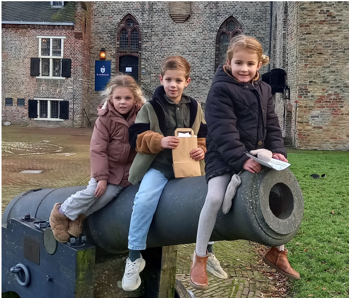
Figuur 2 Kanon als klimtoestel.

In 2023 heeft Kasteel Radboud in totaal 24.434 bezoekers mogen ontvangen.