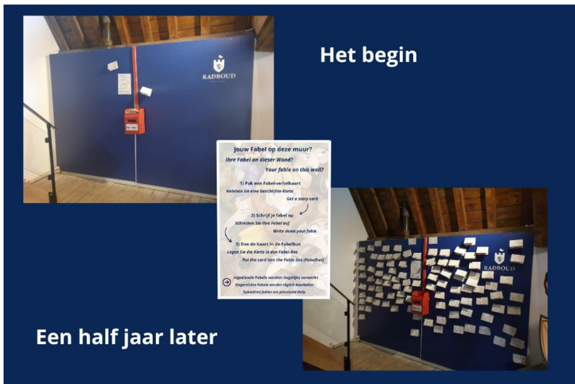
Figuur 4 Fabelmuur op dag 1 en een half jaar later

Na de kennismaking met de Sammeltjes van Wieringen, Tientôn Elfrib, de Boezehappert, de Zuiderzeemeermin, de Zeeridder en de Draak van Staveren, kom je bij de interactieve Fabelmuur. Op de bijgeleverde Fabelkaarten kun je een fabelfiguur uit jouw deel van de wereld met het bijbehorende verhaal delen met volgende bezoekers.