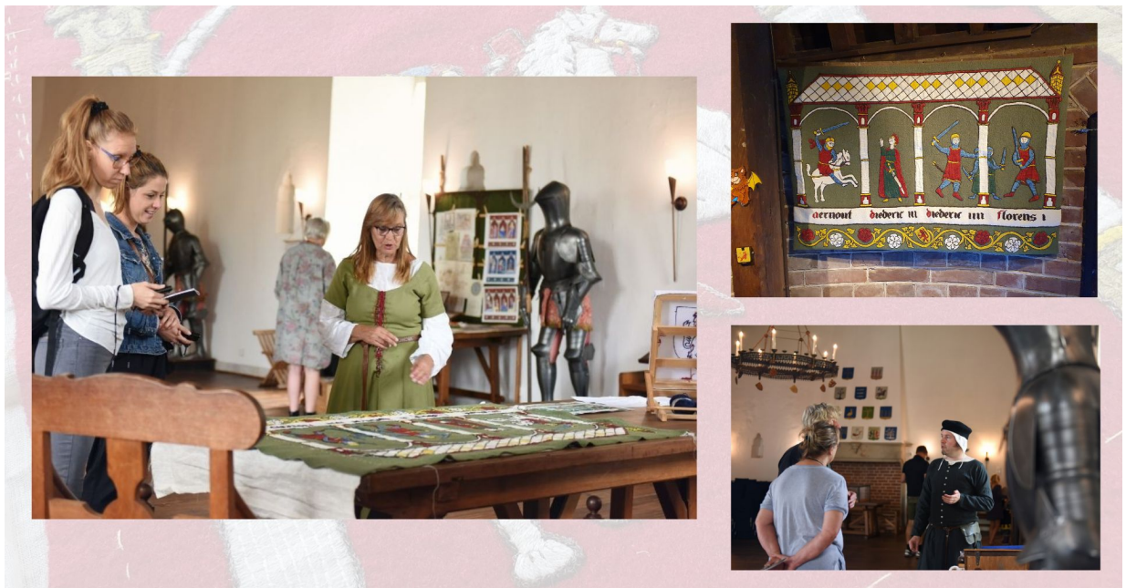
Figuur 7 Collage Graventapijt | Foto's door Yvette Moeskops Fotografie

Het Graventapijt is een uniek project. Textiel is kwetsbaar en er zijn dan ook maar weinig West-Europese middeleeuwse wandtapijten bewaard gebleven. De bekendste en een van de oudste is het Tapijt van Bayeux. Kasteel Radboud wil met het Graventapijt het ambacht van deze wandkleden in ere herstellen, zodat de traditie en werkwijze bewaard blijven voor toekomstige generaties.