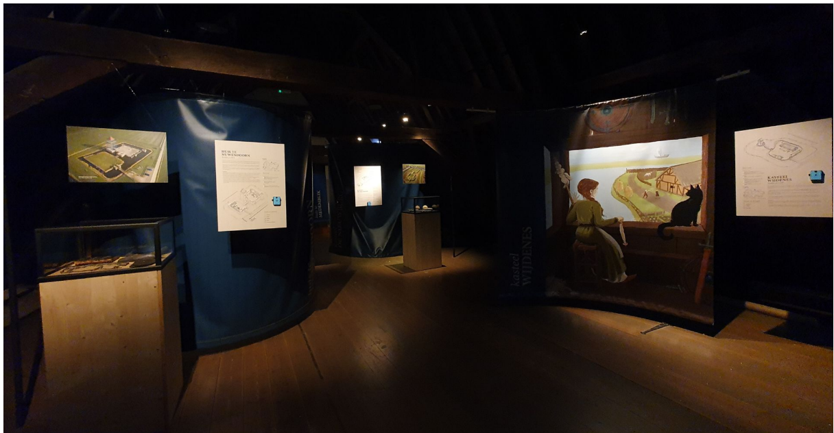
‘Omringd door Kastelen’ op het Groot Hemelrijck