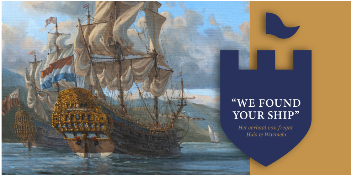
Campagnebeeld “We found your ship”

‘Duik mee naar een diepte van 60 meter, waar het wrak van een Medemblicker fregat op de zeebodem rust. Zeeslagen, verloren levens, families die achterbleven, een vasthoudende historicus en geheimzinnige vondsten vertellen hier samen het verhaal van Huis te Warmelo.’