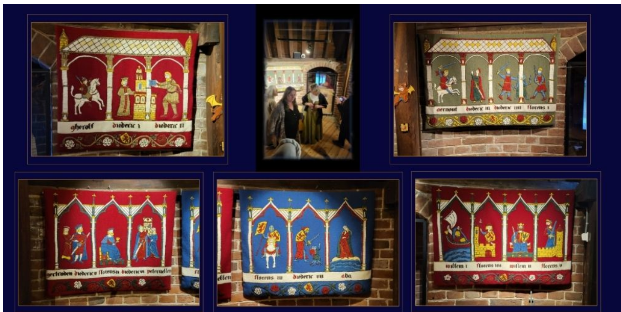
Het Graventapijt, de successiereeks van het Huis van Holland

Het ontwerp is speciaal voor Kasteel Radboud gemaakt door historicus Marius Buijn. De stijl, vorm en inhoud zijn chronologisch aangepast aan de betreffende perioden, eindigend in de stijl van rond 1300. Meer informatie over dit project en de ontwerpen zijn te vinden in de Gravenkamer van het museum.