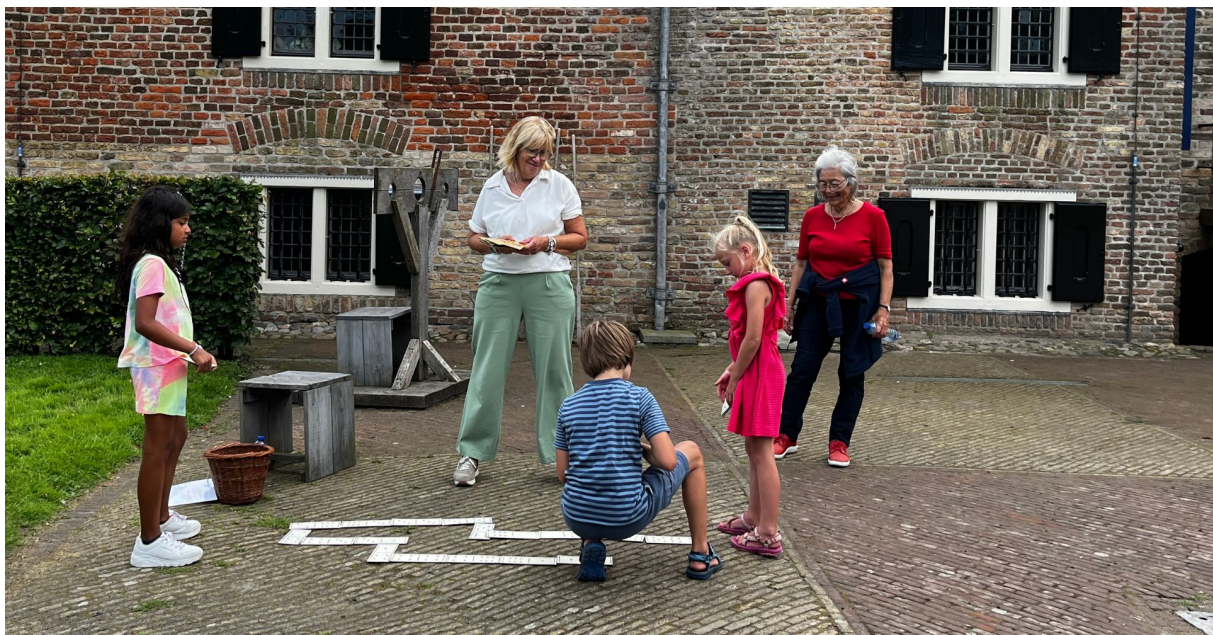
Spelletjesdagen in de zomervakantie