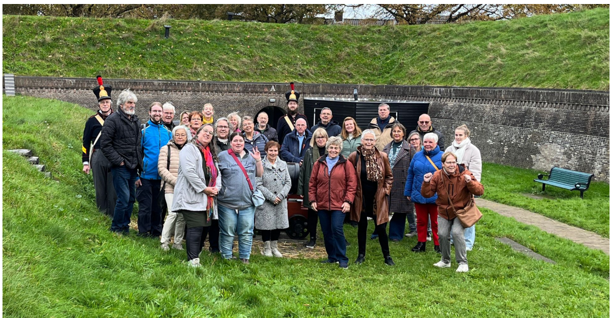
Kasteel Radboud vrijwilligersuitje

Kasteel Radboud kan niet zonder haar vrijwilligers. Ze ontvangen onze museumgasten, bouwen tentoonstellingen op, houden de kruidentuin bij, begeleiden de kinderactiviteiten en houden middeleeuwse technieken voor textielbewerking in leven.