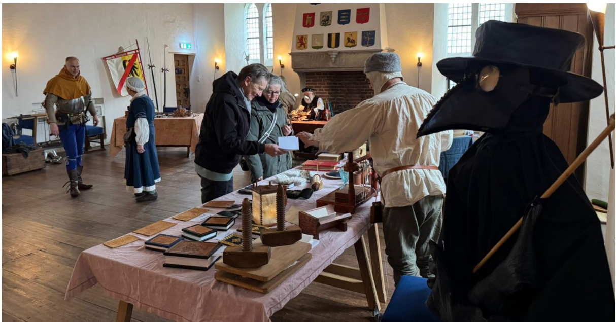
Middeleeuws Weekend, inclusief pestdokter

Dat doen we onder meer via participatieprojecten, zoals 'Alle hens aan dek' bij de tentoonstelling rondom het fregat Huis te Warmelo. Een ander voorbeeld hiervan is de Fabelmuur bij de eerdere tentoonstelling 'Fabel'. De ingediende verhalen uit de hele wereld maakten extra duidelijk dat onze West-Friese volksverhalen veel internationale familie hebben. Geen verhaal zonder moraal: 'Fabel' liet zien dat we eigenlijk allemaal niet zoveel van elkaar verschillen.